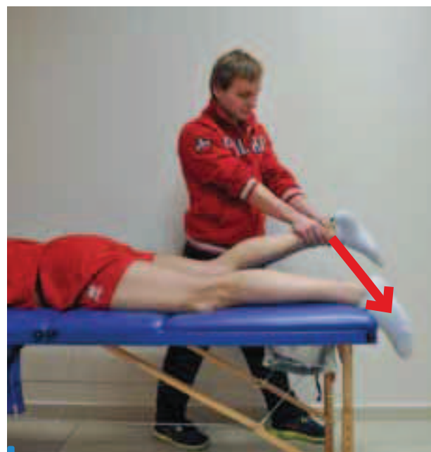
Zdj. 7. Ekscentryczny test grupy tylnej mięśni uda. Pozycja wyjściowa: pacjent leży przodem ze stawem kolanowym zgiętym do 15^\circ , terapeuta podtrzymuje kończynę. Ruch: terapeuta prostuje kończynę dolną w stawie kolanowym przeciwko oporowi pacjenta