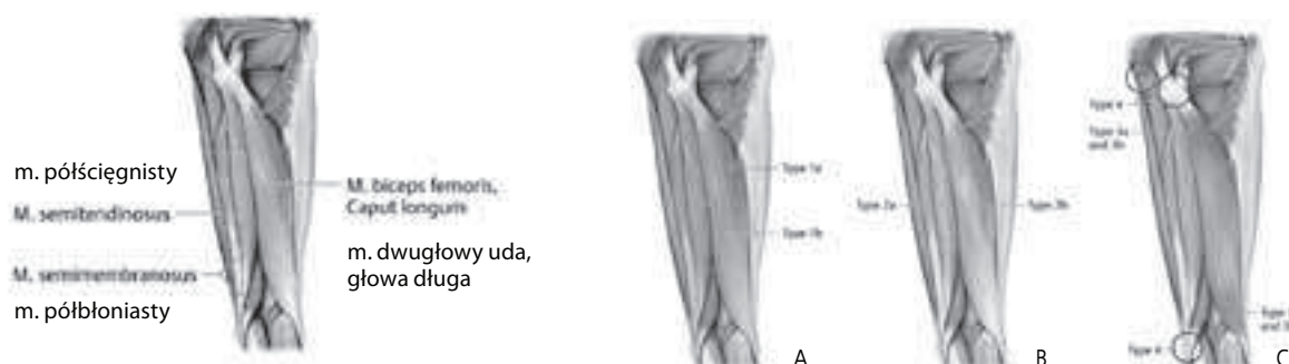
Rys. 1. Rysunek anatomiczny przedstawiający lokalizację funkcjonalnych i strukturalnych urazów grupy tylnej mięśni uda. A. Zaburzenia typu 1 spowodowane nadmiernym wysiłkiem. B. Nerwowo-mięśniowe zaburzenia typu 2. C. Częściowe i całościowe naderwania/zerwania mięśni [20]

Petersen w swojej klasyfikacji odniósł się do symptomów, które mogą okazać się szczególnie pomocne w diagnostyce fizjoterapeutycznej: