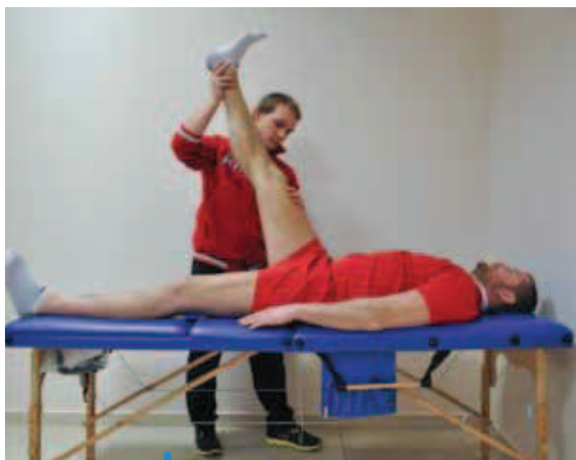
Zdj. 8. Test SLR. Pozycja wyjściowa: pacjent leży tyłem na stole rehabilitacyjnym, ramiona wzdłuż tułowia, kończyny dolne wyprostowane. Ruch: terapeuta zgina kończynę dolną pacjenta do momentu wystąpienia bólu bądź do końca zakresu ruchomości