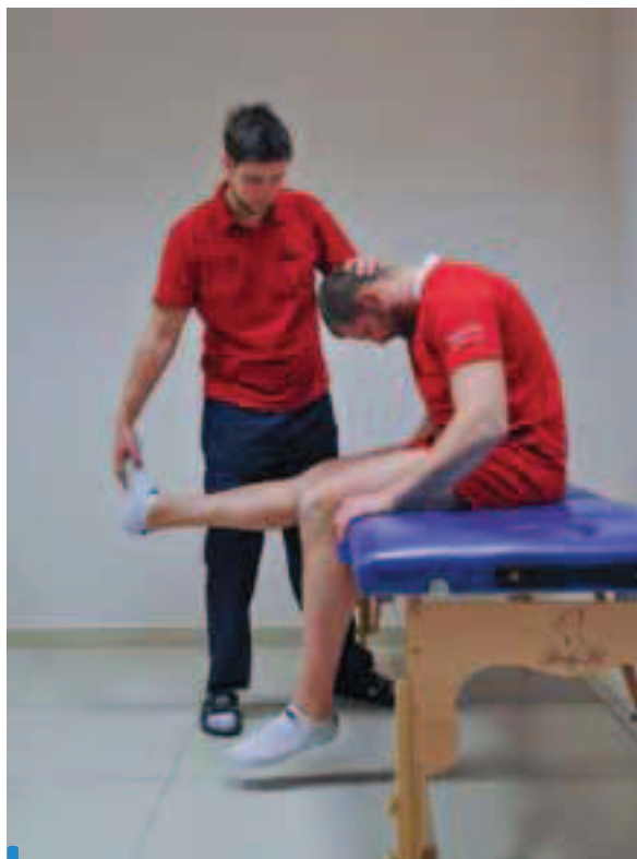
Zdj. 4. Slump test . Pozycja wyjściowa: siad z podudziami swobodnie opuszczonymi poza stół. Ramiona swobodnie oparte o krawędź stołu. Ruch: terapeuta wykonuje wyprost kończyny dolnej po urazie w stawie kolanowym (ze zgięciem grzbietowym stopy) wraz ze zgięciem kręgosłupa szyjnego i tułowia w przód

4 Ekscentryczny test grupy tylnej mięśni uda (zdj. 7) – wykonywany w leżeniu przodem, z kończyną dolną zgiętą do 15° w stawie kolanowym. Prostowanie kończyny w stawie kolanowym przez badającego przeciwko oporowi pacjenta.