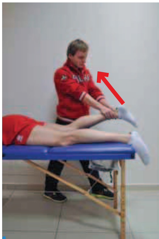
Zdj. 5. Koncentryczny test grupy tylnej mięśni uda z oporem. Pozycja wyjściowa: pacjent leży przodem z wyprostowanym stawem kolanowym. Terapeuta układa dłoń w okolicach ścięgna Achillesa. Ruch: pacjent wykonuje zgięcie stawu kolanowego do 90° przeciw oporowi terapeuty