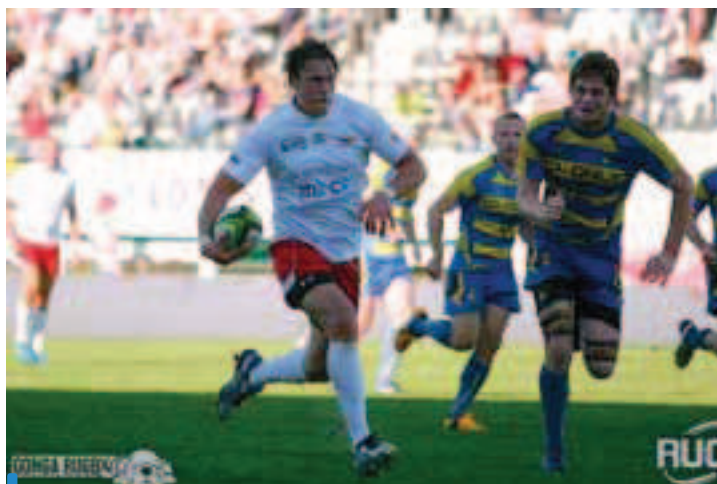
Zdj. 1. Typowa pozycja do bezkontaktowego urazu grupy tylnej mięśni uda podczas sprintu. Staw kolanowy ustawiony w ok. 30° zgięcia, przejście z pracy ekscentrycznej do koncentrycznej mięśni wchodzących w skład grupy tylnej mięśni uda