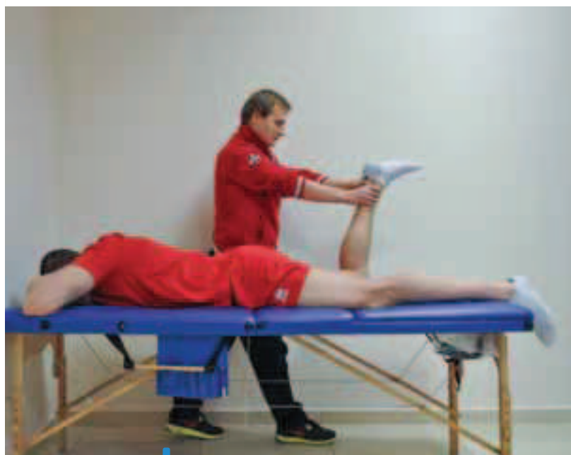
Zdj. 6. Izometryczny test grupy tylnej mięśni uda w kącie 90^\circ zgięcia stawu kolanowego. Pozycja wyjściowa: pacjent leży przodem ze stawem kolanowym zgiętym do 90^\circ . Ruch: pacjent dozuje siłę w kierunku zwiększenia zgięcia stawu kolanowego, terapeuta przeciwstawia się temu oporowi. Następuje skurcz izometryczny